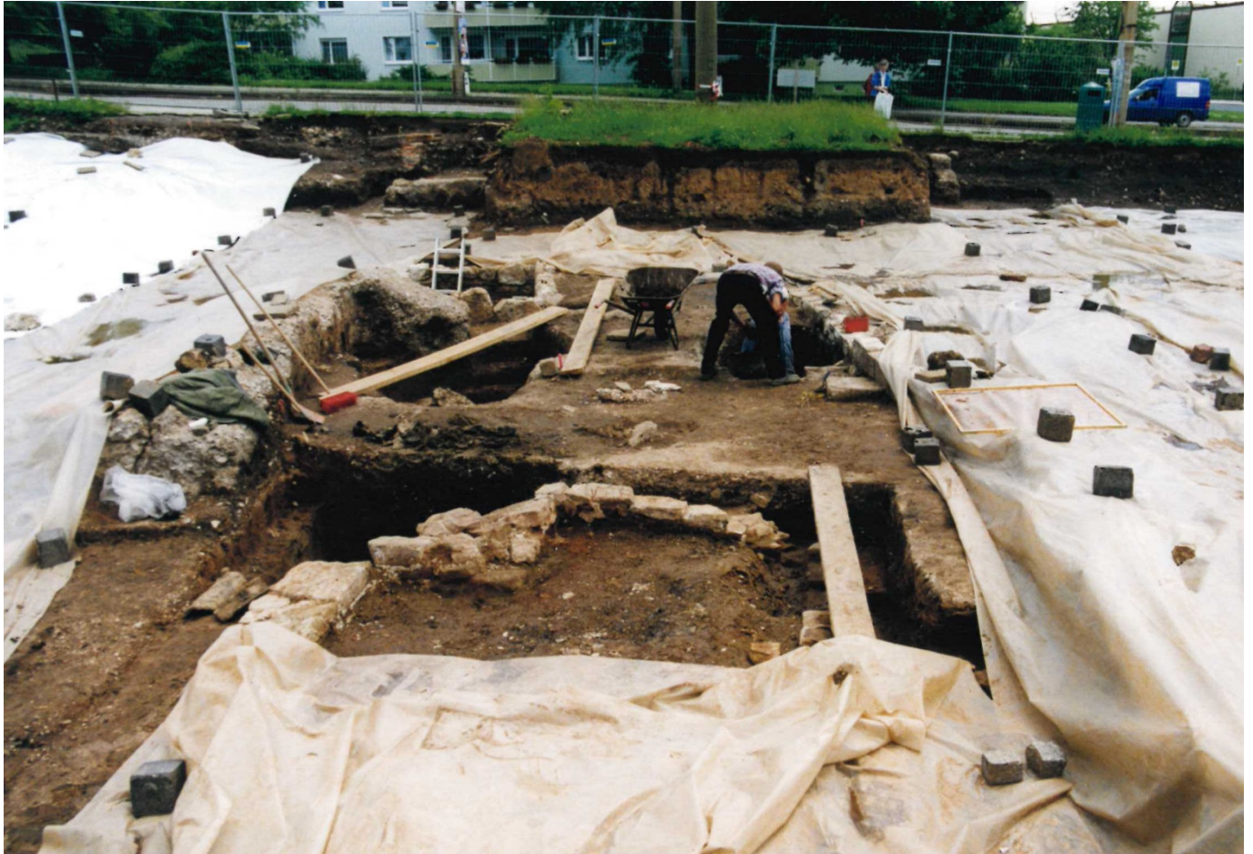
Archäologische Ausgrabungen 1999 an der unteren Rautenstraße in Nordhausen, Foto: Verf.