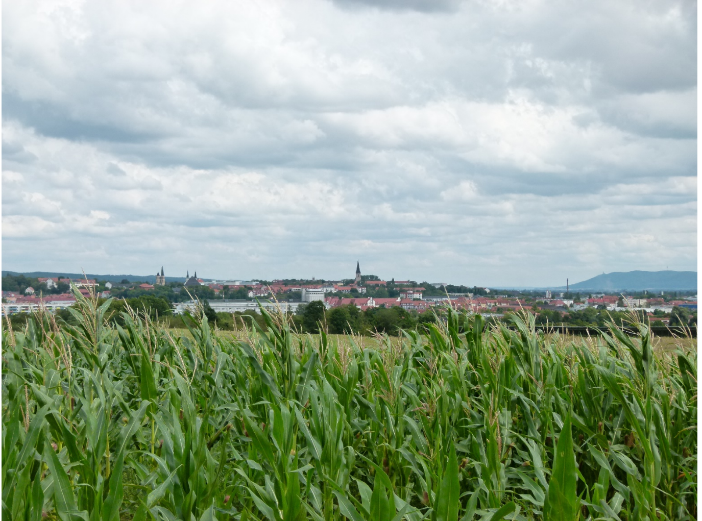
Nordhausen von der Abendseite, 2023